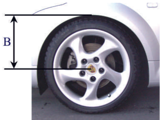
Abstandsmaß B - Radmitte - Kotflügelunterkante

In dieser Tabelle ist die eingestellte Höhe des umgerüsteten Fahrzeugs einzutragen: