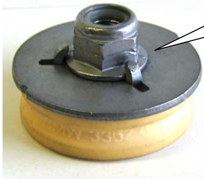
Original Mutter mit Scheibe.